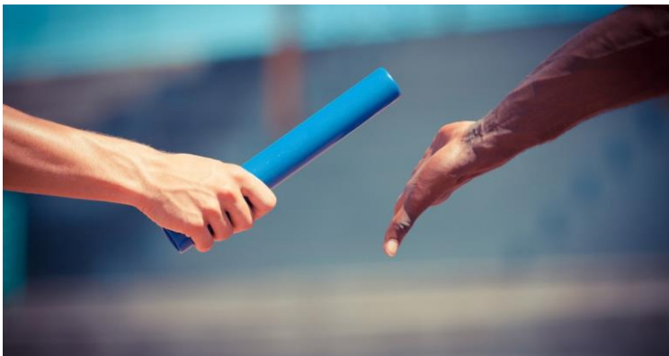
Partijlintjes, voor markering zandbed en tikkerspellen warming-up